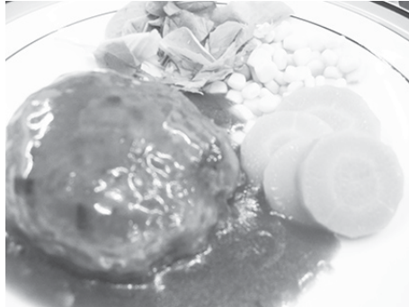
昼食会 みんな大好きハンバーグ♡