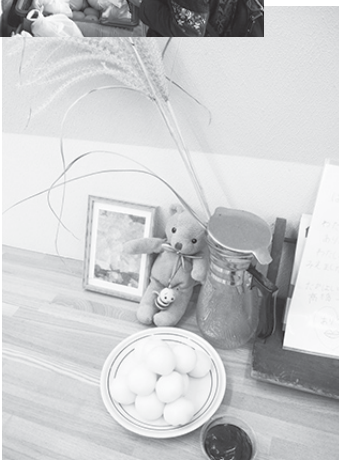
今日はお月見の日です