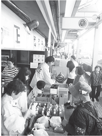
福引きのお手伝い「大当たり〜」