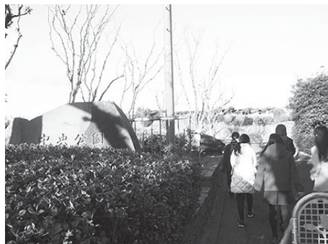
↑避難訓練！ 中央公園まで歩いてみました♪