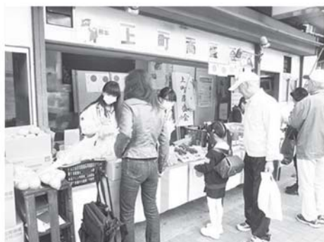
収穫祭の お手伝い