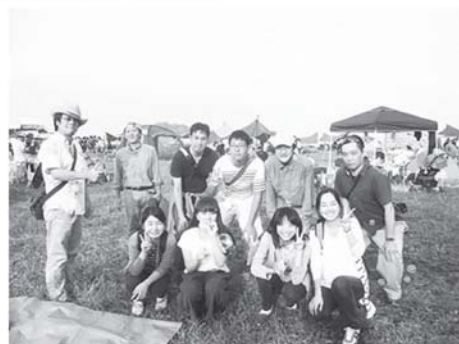
うみかぜ公園でバーベキュー♪