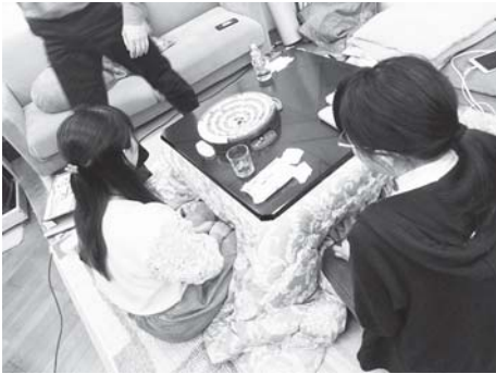
沈没大作戦！ 白熱の戦い！！ けっこう盛り上がりましたよ。