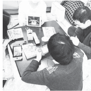
こたつでまったり〜 ゲームに夢中！