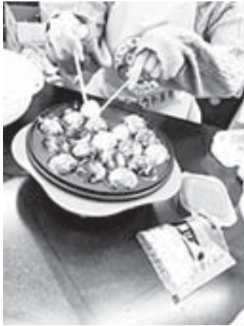
お誕生会はタコパ！