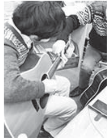
ギター、上達してますよ☆