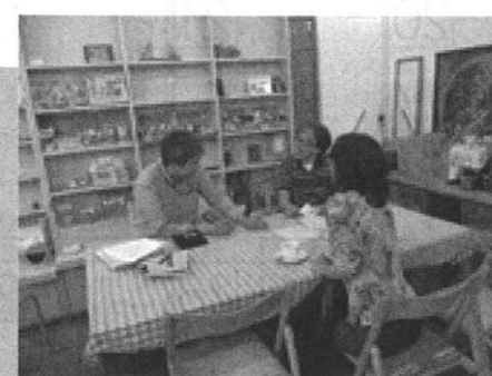
ボランティア・ミーティング中