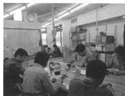
学習スペースでお昼ごはん!

毎年ゴーヤの蔓が枯れる秋には、キレイに片付けてアーケードの上に縛ってあるはずのネットなのですが、解いてみると1年の風雨でネットが切れていたり、絡まったりしてあります。まずは、その修復から始まります。それが終わるとアーケードの下へとネットを下げて、見た目にも、張り具合もちょうど良い感じの高さを見定めます。ロープの上の端をアーケードの手すりに縛って固定してから、下も歩道のガードレールへ固定して回りました。そんな作業をこなしていると、商店の方々からも色々な意見が出て指示のもとネットを張ったり、ご苦労様と声をかけて頂いたり、差し入れを頂いたりしました。今年は今までより動ける人数が少なかったのですが、一番効率よく出来た事に満足しています。この調子でいくと、ゴーヤのネット張りの道を極めてしまいそうです!?(アキラ)