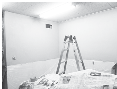
壁を塗替え作業中！