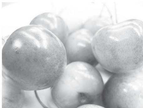
幻のさくらんぼ天香錦